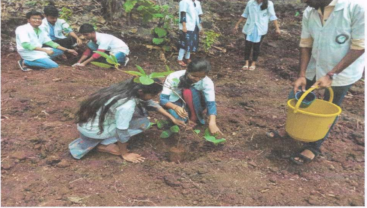
महाविद्यालयाच्या विद्यार्थ्यांच्या हस्ते वृक्षारोपण